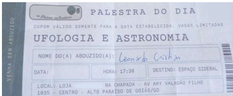
Figura 7 - Ingresso para a palestra sobre Exobiologia.

A exobiologia, ou astrobiologia, é um ramo das ciências naturais que tem como base a investigação sobre a existência de vida fora do planeta Terra, além da busca pela origem da vida, sua evolução e distribuição pelo universo 35 . No campo da Ufologia, as interações com exobiologia são enfocadas nos contatos com seres extraterrestres e a comparação desses seres com espécies existentes em nosso planeta, de modo a deduzir o funcionamento desses indivíduos. Fiquei curioso acerca dessa abordagem e resolvi assistir a palestra de Felipe.