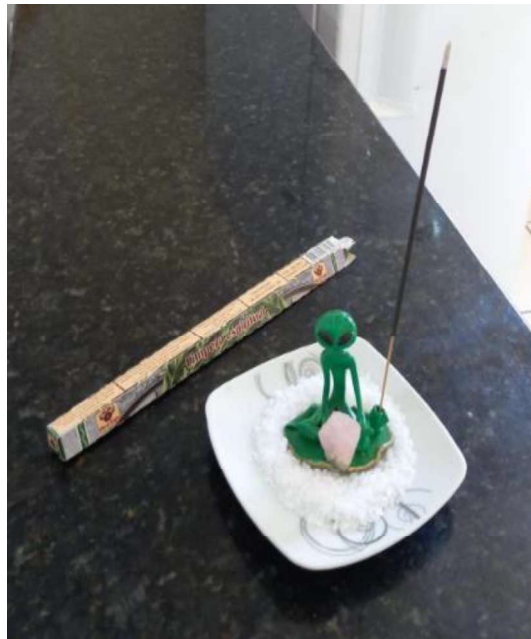
Figura 8 - Incensário Alien com pedra de Quartzo Rosa.