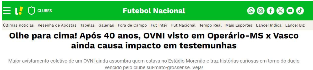
Figura 12 – Matéria do Jornal Lance, sobre os 40 anos do avistamento

completou 40 anos. Outra grande mídia esportiva a noticiar o “Caso Morenã” posteriormente foi o Lance , também em celebração dos 40 anos do avistamento.