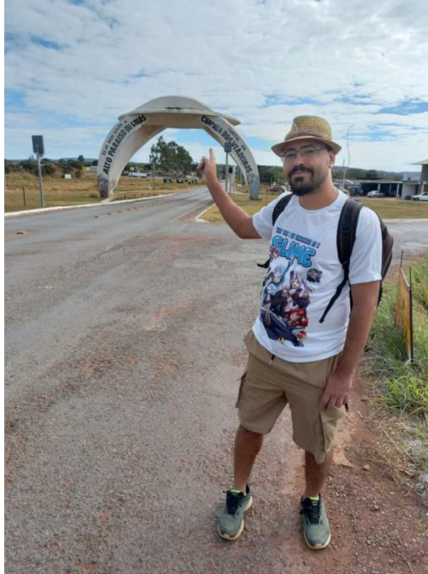
Figura 1 – Pórtico da cidade de Alto Paraíso de Goiás.

Na entrada da cidade, há um portal em formato de disco voador. O Pórtico de Alto Paraíso de Goiás, que era completamente branco, recebeu uma restauração e pintura, acrescentando o slogan da cidade, "Capital da Chapada dos Veadeiros", e desenhos da fauna local. Essa estrutura não apenas adiciona um toque de singularidade à entrada da cidade, mas também simboliza os dois elementos basilares do turismo na região.