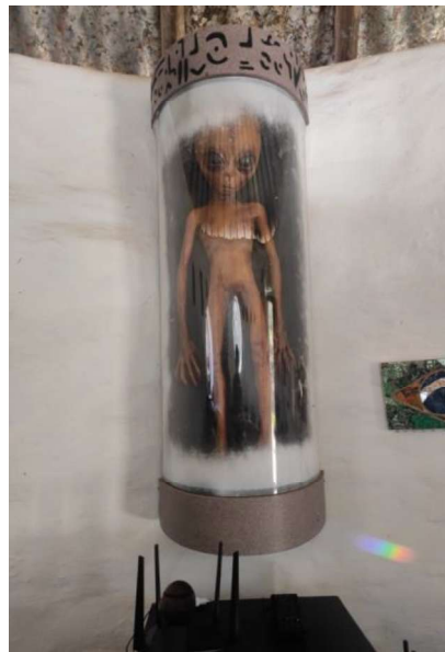
Figura 6 – Extraterrestre em uma cúpula.