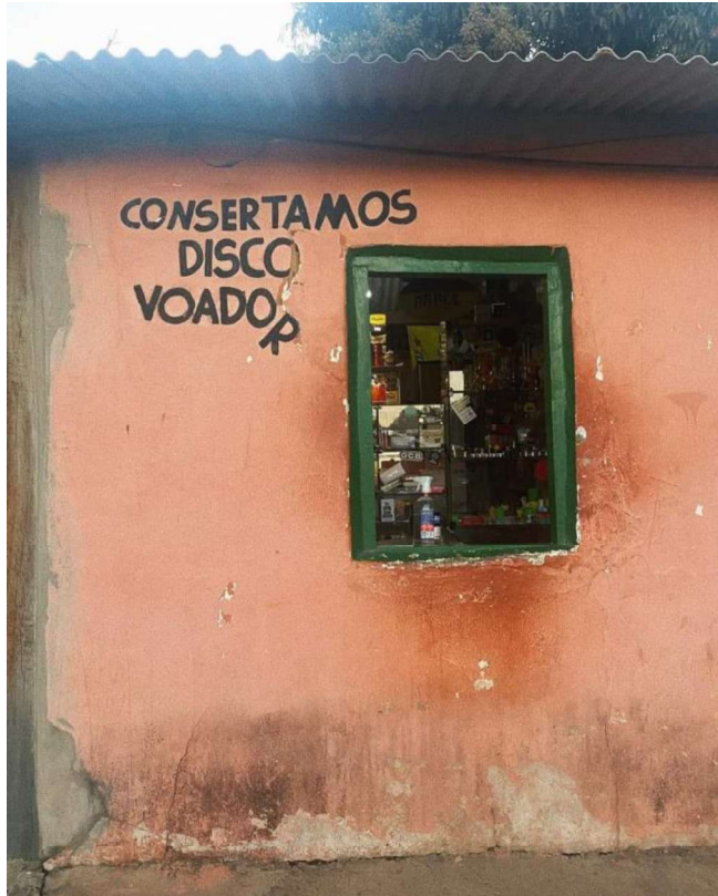
Figura 2 – Tabacaria em Alto Paraíso de Goiás.

Casas e estabelecimentos comerciais, como essa tabacaria, também apresentam elementos da mitologia extraterrestre. Há diversos relatos de quedas de discos voadores, como no “Caso Roswell” 33 , ou de pousos forçados das naves para reparos, como no "Caso Lonnie Zamora". A loja retratada aproveita esse componente comum nas narrativas míticas e o integra à sua arquitetura, proporcionando uma imersão na cultura ufológica e na fascinação pelo desconhecido.