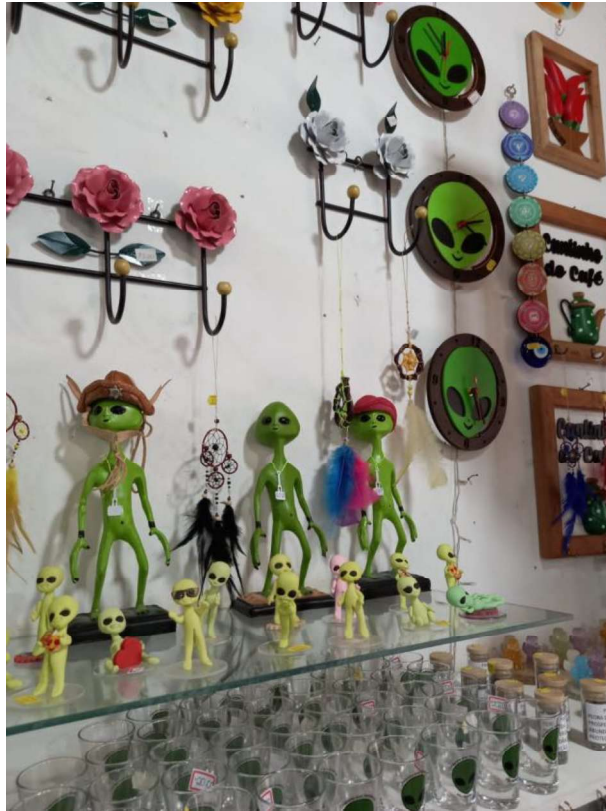
Figura 4 – Produtos das lojas de Alto Paraíso de Goiás.

As lojas de Alto Paraíso de Goiás comercializam produtos que incorporam aspectos da vivência humana ao imaginário dos alienígenas. Essa interação entre Ufologia, misticismo e a vida cotidiana cria um ambiente onde o encontro entre o desconhecido e o espiritual se entrelaçam sobremaneira. O comércio local não apenas reflete essa ligação, mas também a fortalece, oferecendo uma ampla gama de produtos e serviços que abarcam tanto as crenças ufológicas quanto as espirituais. Há, portanto, uma convivência entre diferentes perspectivas, que parece enriquecer a atmosfera da região, fomentando a compreensão mútua e a celebração da diversidade, valores centrais no contexto do neo-esoterismo que permeia a comunidade. Isso se aplica tanto no respeito às diferentes crenças e símbolos, quanto no que tange a populações vistas como minorias sociais, como mulheres, indígenas e LGBTQIAPN+.