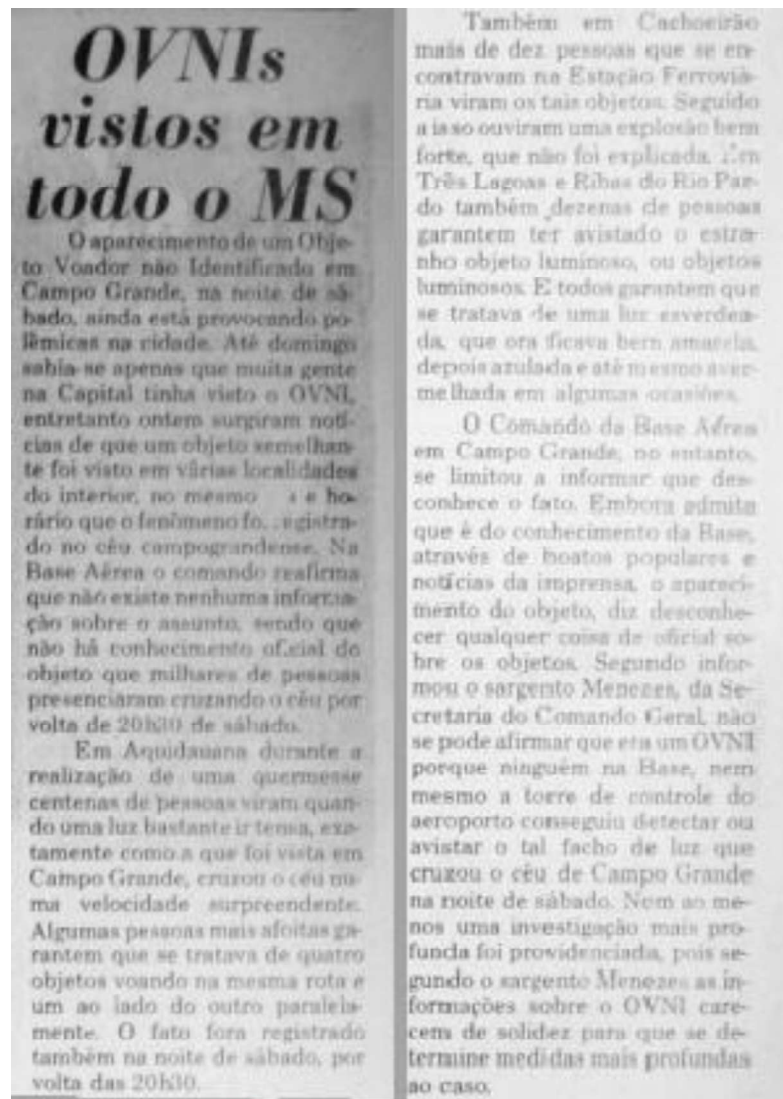
Figura 11 – Reportagem do Correio do Estado do dia 09/03/1982

Quanto às menções ao disco voador nos jornais Correio do Estado, nos dias 08 e 09 de março de 1982, as notícias sobre o avistamento ganharam um destaque maior com o surgimento de outros depoimentos de avistamentos fora do estádio e em cidades do interior. Esses relatos adicionais alimentaram especulações e debates sobre a natureza do fenômeno e sua possível origem, ampliando o interesse público e a cobertura midiática em torno do assunto, especialmente com a cobertura de Ademar Gervær. O avistamento do disco voador tornou-se então parte de uma série de narrativas que fascinaram a população de Campo Grande e região.