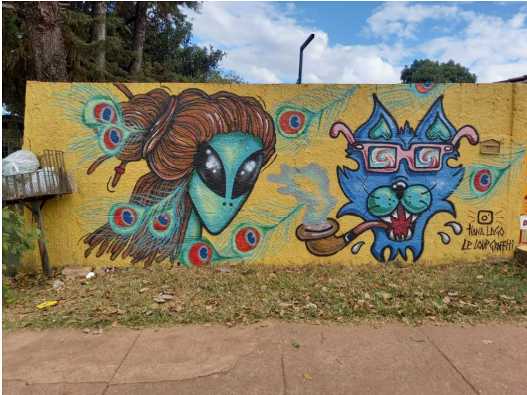
Figura 3 – Grafite em Alto Paraíso de Goiás.

A junção entre manifestações culturais urbanas, como o rap e o grafite, e elementos da Ufologia é um aspecto marcante da cidade. É possível perceber que a Ufologia e o misticismo estão inseridos no cotidiano dos moradores de Alto Paraíso e nas relações interpessoais. O comércio local, vital para a sustentabilidade dos residentes, reflete essa estreita ligação com o fenômeno UFO, adicionando uma camada adicional de diversidade e respeito às diferenças humanas. Essa característica é emblemática do neo-esoterismo, revelando-se como uma expressão não apenas de crenças individuais, mas também como um fator integrador que fortalece os laços comunitários. Assim, a singularidade de Alto Paraíso transcende a esfera das crenças pessoais, manifestando-se em uma teia complexa de expressões culturais que enriquecem a experiência urbana, consolidando a cidade como um ponto de convergência entre a modernidade urbana e o enraizamento espiritual e ufológico de sua população.